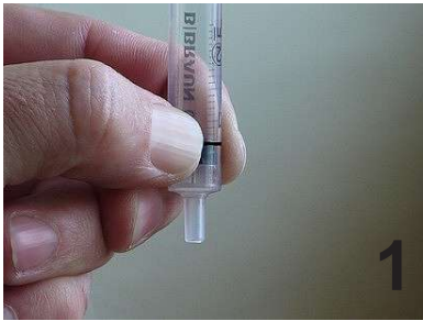
FOTO NÁVOD na plnenie strely